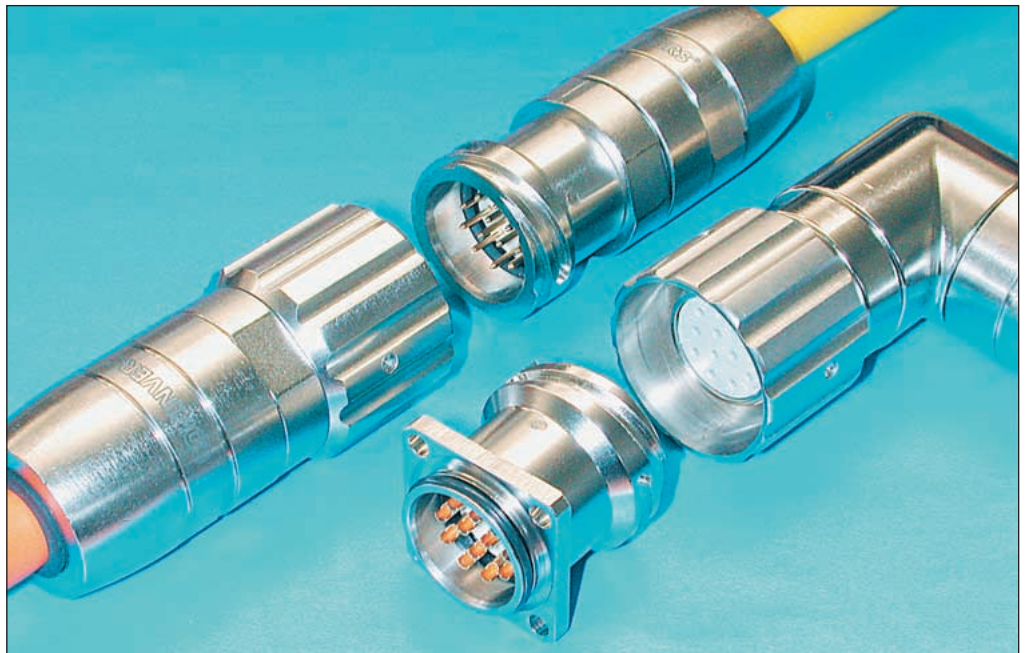
Neue Serie TU: Bajonett-Verriegelung, erweiterter Kabeleinlass-Bereich bis \varnothing 14,5 mm und universelle Schirmanbindung

Diese Serie wird nun erweitert, indem anstelle der M23 Schraubverriegelung eine Bajonett-Verriegelung eingeführt wird. Die neue Produktfamilie begründet die TU Serie.