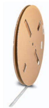
C-HC Buchsenkontakte Ø 1 mm/Ø 2 mm

CONINVERS C-HC sind gestanz-gerollte Crimpkontakte mit integriertem Draht- und Isolationscrimp. Die Kontakte werden als Bandware auf Rollen à 2.500 oder 10.000 Stück geliefert. Zur Verarbeitung von Kleinmengen stehen Verpackungen mit 100 oder 200 Kontakten am Band zur Verfügung.